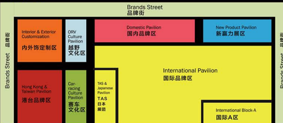
EXHIBIT RANGE 参展品类 展示品類型